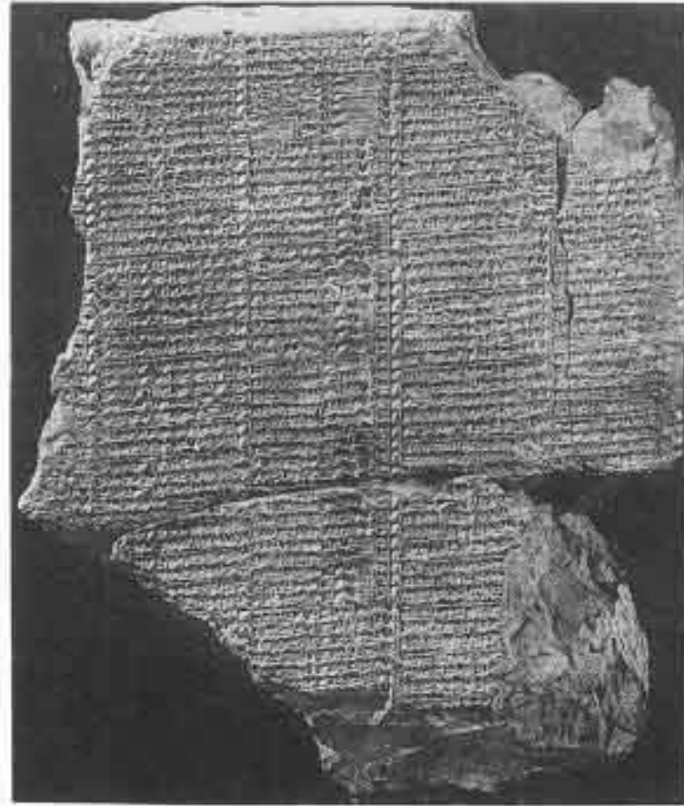
قانون لبيت عشتار