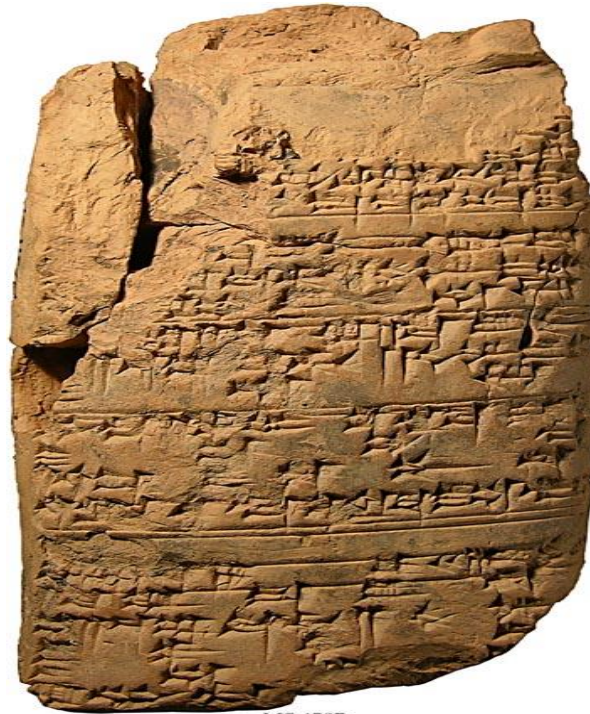
MS 4507 Law codes of Eshnunna or Hammurabi. Babylonia, ca. 1900-1650 BC