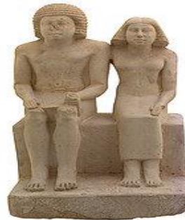
الفرعون خوفو وزوجته