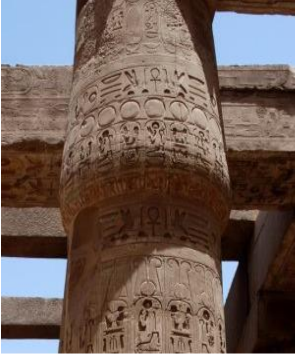
أحد أعمدة معبد الكرك