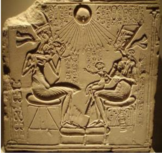
أختاتون وزوجته نفرتيتي وفوقهما إله الشمس