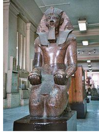
الفرعون تحوتمس الثالث