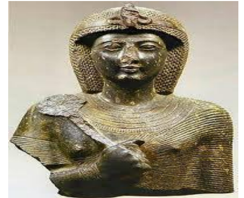
الفرعون رمسيس الثاني