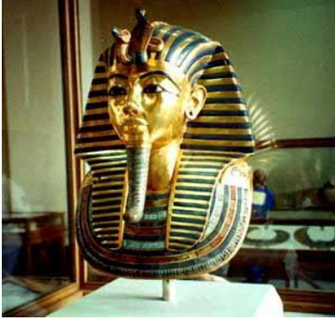
الفرعون توت عنخ آمون آمون