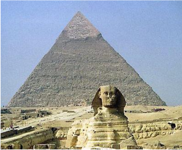
تمثال أبو الهول