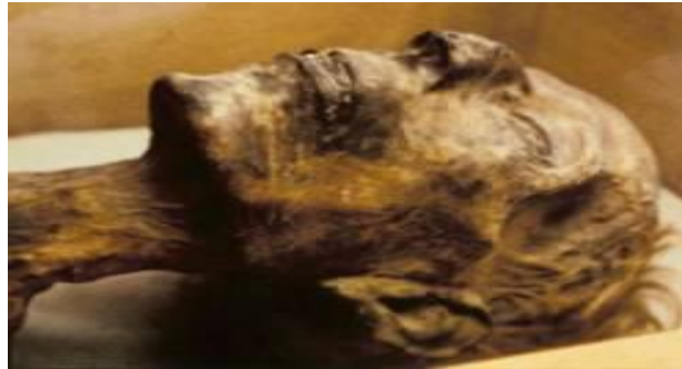
مومياء الفرعون رمسيس الثاني