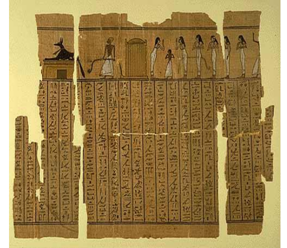
جزء من كتاب الموتى