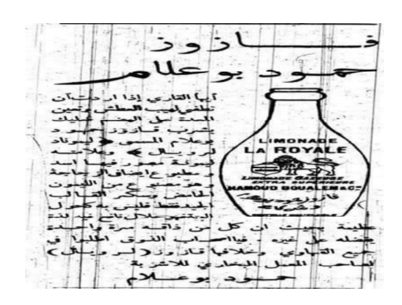
والشكل الثاني (03) يوضح العلامة التجارية لحمود بوعلام حين إطلاقها

الجرافيكي للعلامة التجارية حمود بوعلام تخصص المؤسسة في قطاع المشروبات متخذة الأسد كرمز لقوتها وهيمنتها السوقية كعلامة تجارية جزائرية مُتحديّة لمنافسيها في نفس القطاع الإنتاجي لاسيما العلامتين التجاريتين كوكاكولا وبيبسي، كما يعكس التصميم الجرافيكي للعلامة التجارية "حمود بوعلام" تطلعاتها، قيمها، وطموحاتها في التفرد و التربع على عرش إنتاج المشروبات في الجزائر وهذا يوضح رؤيتها المعهودة كنا هنا ومازلنا، ونجد أنَّ شكل العلامة التجارية لحمود بوعلام لم يتغير منذ بدايتها إلى يومنا هذا وهذا لتأكيد تجذُّرها في البيئة التسويقية الجزائرية، والشكل الثاني يوضح العلامة التجارية لحمود بوعلام حين إطلاقها.