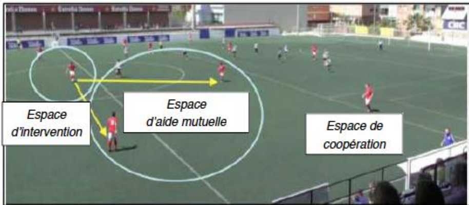
Figure n° 03: les espaces distincts autour du ballon.

A l'image de ce que l'on peut observer sur cette image, 2 joueurs se situent dans l'espace d'aide mutuelle et 1 autre joueur occupe l'espace de coopération.