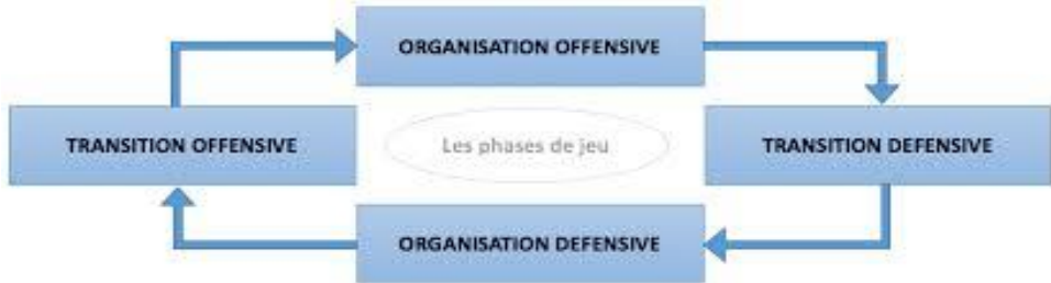
Figure n° 01 : Les moments du jeu en football.