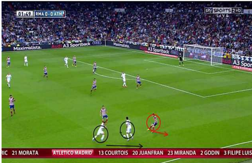
Figure n° 07: Real Madrid VS Atlético Madrid.

Dans l'image ci-dessus on peut observer comment une communication coordonnée permet de créer une supériorité dans le jeu.