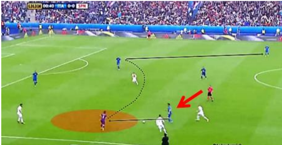
Figure n° 05: Italie VS Espagne.

Sur cette image, les joueurs de la sélection italienne ont identifié qu'un joueur libre se trouvait sur le côté opposé au ballon. Ainsi, le joueur dos au jeu, donc mal orienté va jouer face à lui, pour son partenaire orienté face au jeu non seulement parce qu'il ne peut pas renverser lui-même, mais aussi parce que cette passe va permettre d'attirer, d'amener 4 adversaires dans ce secteur du terrain (petit côté) (Olivier ALBEROLA, volet 4, 2018, pp 1-4).