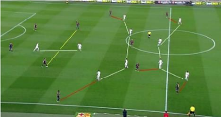
Figure n° 02. FC Barcelona VS Real Madrid.