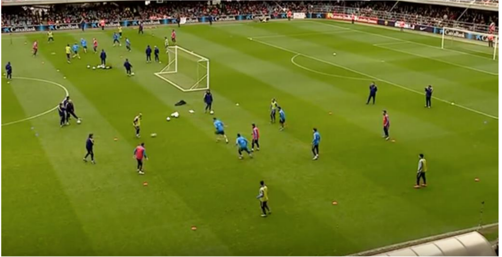
Figure n° 08: Jeu de position en effectif global utilisé par Luis Enrique avec le club de Barcelone FC.